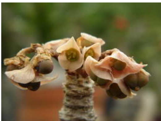
Euphorbia cremersii, fruits

Si la pollinisation a été faite au bon moment, les fruits se développent sur une période de 3 à 4 semaines avant d'arriver à maturité.