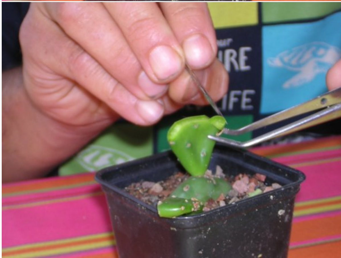
On prend le greffon de l'année.