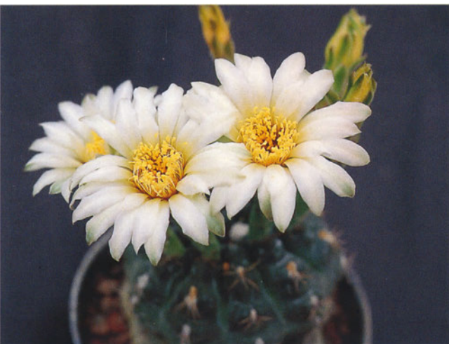
Abb. 7: Detail der Blüte von Gymnocalycium schroederianum subsp. boessii .

Papsch [non (Lemaire) Britton & Rose] subsp. schröderianum (Osten) Papsch, Gymnocalycium 14(1): 390. 2001.