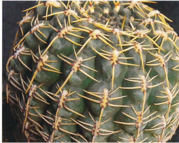
Abb. 9: Gymnocalycium schroederianum subsp. schroederianum .