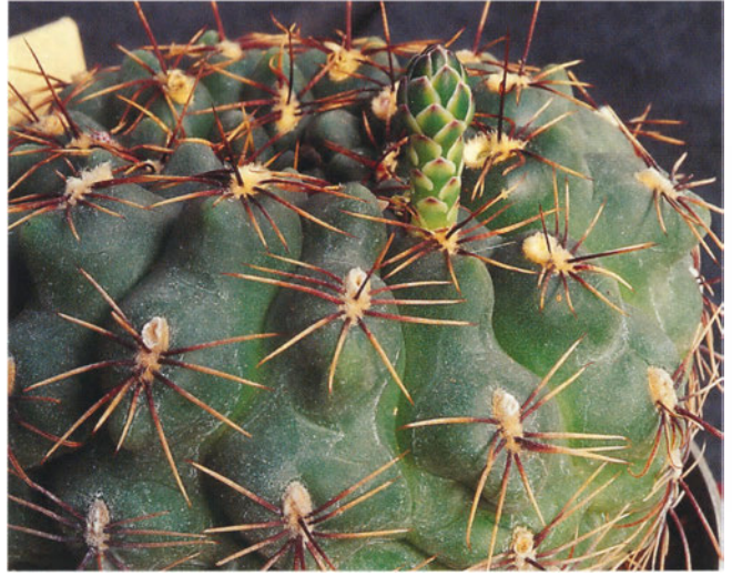
Abb. 5: Sprossdetail von Gymnocalycium schroederianum subsp. boessii , mit Knospe.

Gymnocalycium -Arten der Provinz Buenos Aires, hält das in den Sierras Bayas vorkommende Gymnocalycium schroederianum subsp. bayensis R. Kiesling (Untergattung Gymnocalycium ) für den echten, alten Echinocactus hyptiacanthus Lemaire (1839), und in Konsequenz bezeichnet er einen Neotypus für diesen Namen. Hierfür lehnt er den für Echinocactus hyptiacanthus bereits vorher von KIESLING (1999) bestimmten Typus ab (ein Exemplar aus Uruguay, Untergattung Macrosemineum ), weil er irrtümlich als Lectotypus bezeichnet wurde. Diese Ablehnung ist jedoch unberechtigt, da der ICBN (GREUTER & al. 2000: Art. 9.8) hier ganz klar aussagt: Der irrtümliche „Gebrauch des im Code ... defi-