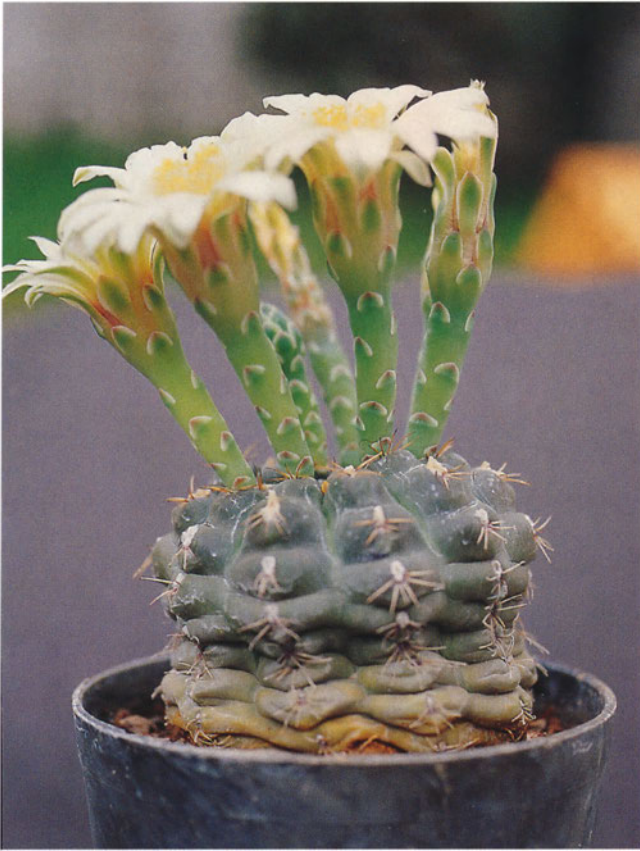
Abb. 6: Pflanze von Gymnocalycium schroederianum subsp. boessii in voller Blüte.