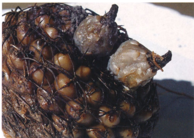
Abb. 12: Nasspräparat von Daguerre im Naturhistorischen Museum von Buenos Aires (BA 13476): Gymnocalycium melanocarpum ?

Mus. Hist. Nat. Montevideo 2 (4, 1): 1-83 + 71 ills. PAPSCH, W. (2001): The pampinen Gymnocalycium 3. Gymnocalycium hyptiacanthum (Lemaire) Britton & Rose. – Gymnocalycium 14 (1): 385-392. PRESTLÉ, K. H. (2001): Gymnocalycium melanocarpum (Arechavala) Britton & Rose. – Gymnocalycium 14 (3): 413-416.