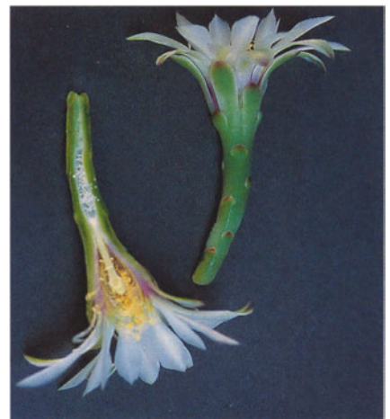
Abb. 8: Längsschnitt durch die Blüte von Gymnocalycium schroederianum subsp. boessii .

Im Beitrag von KIESLING (1987) wurden die Bildunterschriften von Abb. 7 (= subsp. bay-