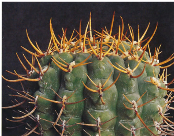
Abb. 10: Gymnocalycium schroederianum subsp. paucicostatum .